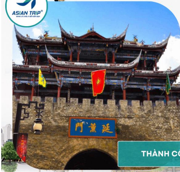
THÀNH CỔ TÙNG PHAN