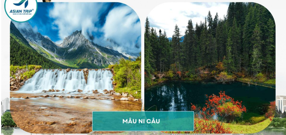
MÂU NI CÂU