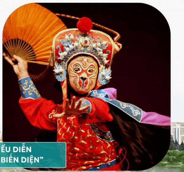
SHOW BIỂU DIỄN TỨ XUYỀN “BIẾN DIỆN”