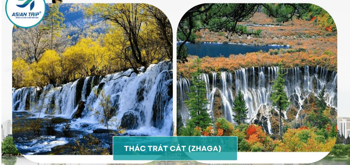
THÁC TRÁT CÁT (ZHAGA)

Buổi Tối: Quý khách tiếp tục khởi hành trở về Huyện Mậu, nghỉ đêm tại khách sạn.