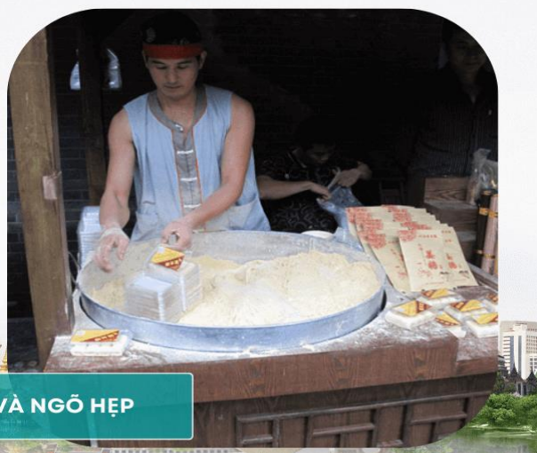
NGÕ RỘNG VÀ NGÕ HẸP

Buổi Trưa: Quý khách ăn trưa, sau đó đi tham quan: