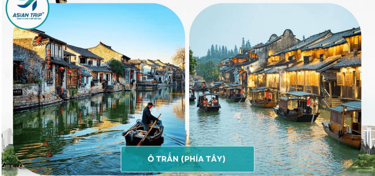
Ô TRẦN (PHÍA TÂY)