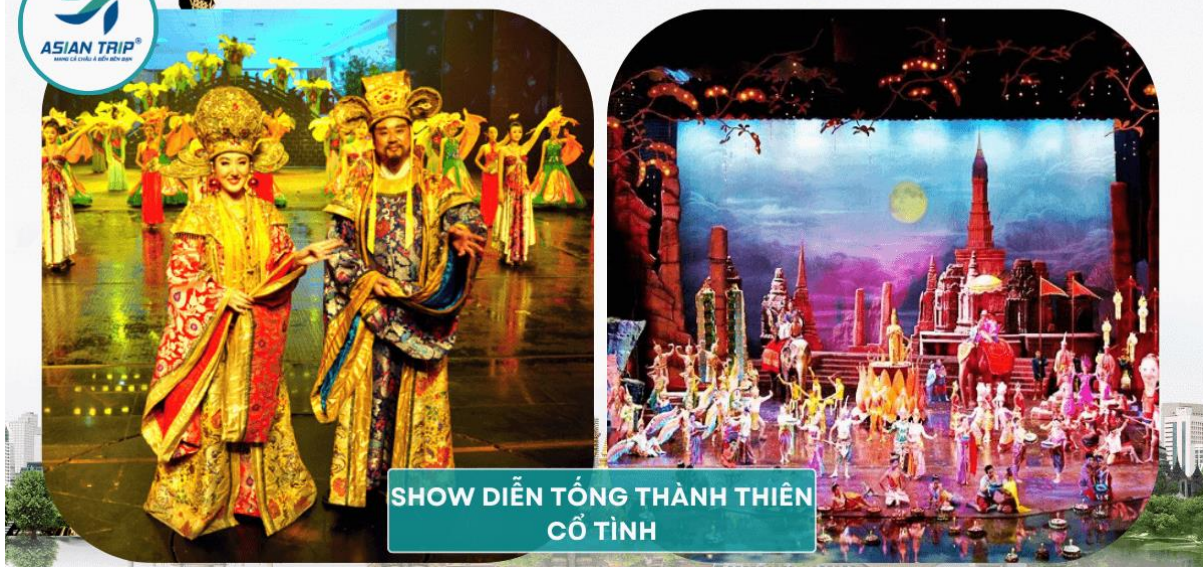
SHOW DIỄN TỔNG THÀNH THIÊN CỔ TÌNH