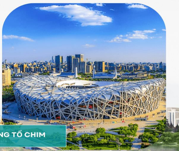
SÂN VẬN ĐỘNG TỔ CHIM

Buổi Tối: Đoàn dùng bữa tối tại nhà hàng địa phương, quý khách có thể tự do khám phá thành phố Bắc Kinh về đêm.