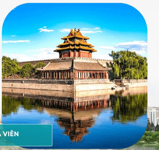
DI HOÀ VIÊN

Buổi Trưa: Đoàn đi ăn trưa nhẹ sau đó xe và HDV đưa đoàn ra sân bay.