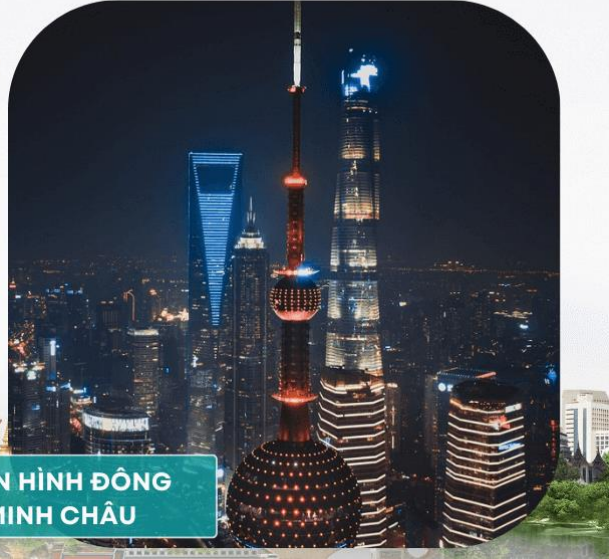
THÁP TRUYỀN HÌNH ĐÔNG PHƯƠNG MINH CHÂU

Buổi Tối: Quý khách ăn tối tại nhà hàng. Sau bữa tối, Quý khách có thể tham gia Chương trình du thuyền trên sông Hoàng Phố ngắm cảnh đẹp hai bờ Tây – Đông thành phố Thượng Hải dưới những ánh đèn đủ màu sắc của các toà nhà cao tầng dọc 2 bên sông hoặc đi tàu điện ngầm khám phá thành phố Thượng Hải về đêm ( chi phí tự túc ). Nghỉ đêm tại khách sạn ở Thượng Hải .